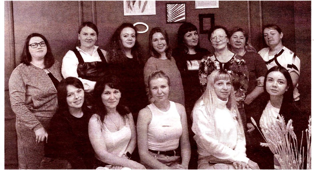
Коллектив Вохтожского ПДК