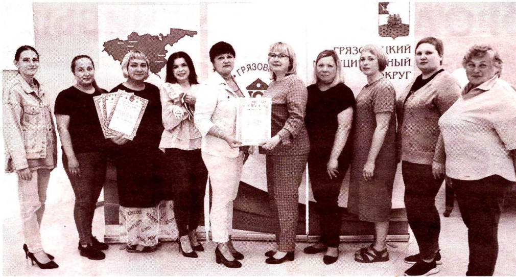
Коллектив Культурно-досугового центра г. Грязовца